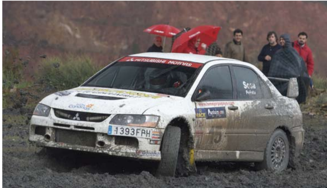
El gran trabajo llevado a cabo por el equipo a lo largo de toda la temporada ha dado al final sus frutos.

Rogelio Peñate era claro también y señalaba "Para Gustavo y todo nuestro equipo nos sirve para redondear una gran temporada".