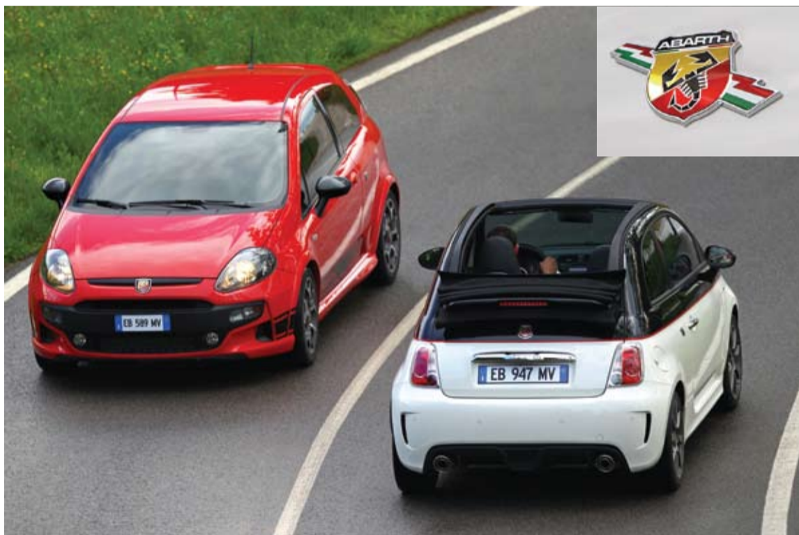
En la competición es una marca ya mítica, prestigiosa y muy bien valorada.