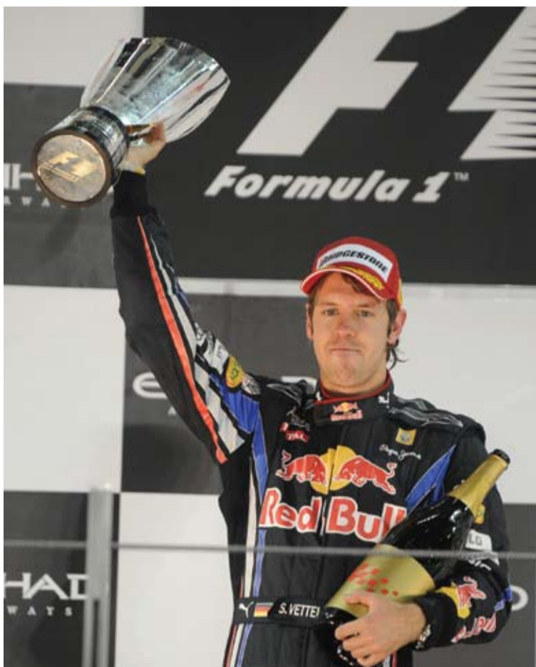
En Abu Dabi Sebastian dominó la carrera con autoridad. Fue justo ganador.

Alcanzamos la última prueba de uno de los mundiales más igualados de la historia. Al espectacular circuito de Abu Dabi llegamos con cuatro pilotos con posibilidades de ser campeones.