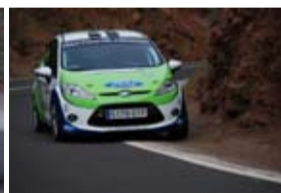
E. Cruz brillante campeón R2.