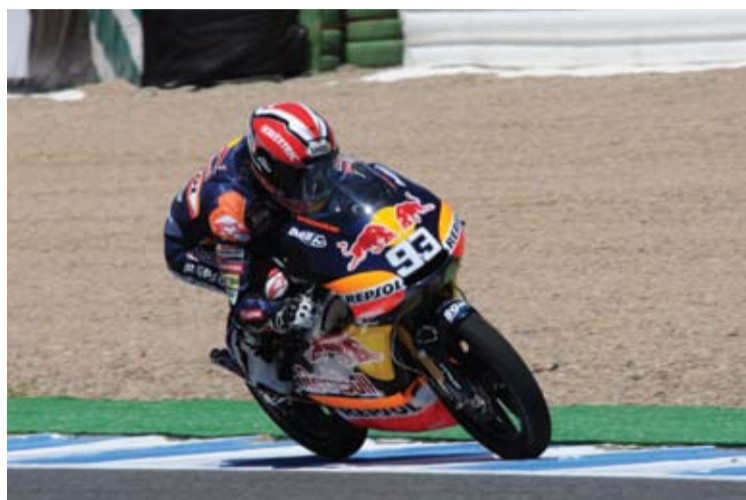
Marc Márquez, brillante campeón de 125cc.

Vini, vidi, vinci o lo que es lo mismo, dar un paso atrás, bajar a Moto2, dejar atrás Moto GP, ganar el campeonato del Mundo para volver a subir a la categoría reina. Eso es lo que ha hecho Toni Elías, llegar, ver y vencer. No lo ha tenido fácil el manresano para lograr el título, ha tenido que vérselas con lesiones, enfermedades y una categoría nueva pero el incansable Toni ha trabajado más que nadie, aunque su moto no fuese la más rápida, para alcanzar su sueño. Lo ha logrado a pesar de tener que vérselas con duros rivales,