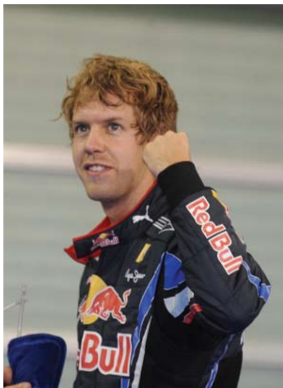
A lo largo de la temporada los Red Bull han sido los mejores.