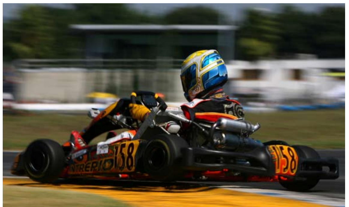
El tinerfeño suma su segunda corona como Campeón de España.