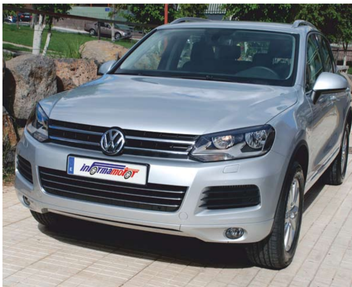
Imponente la vista frontal del nuevo Volkswagen Touareg.