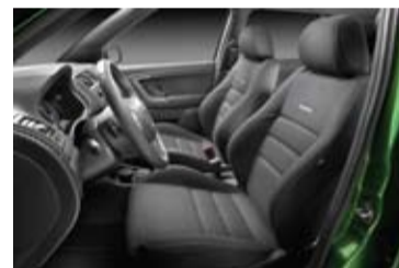
Tapicería deportiva de tela.