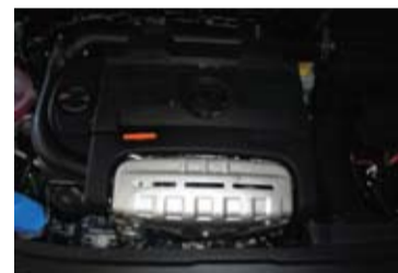
Motor TSI 1400cc. Turbo y compresor.