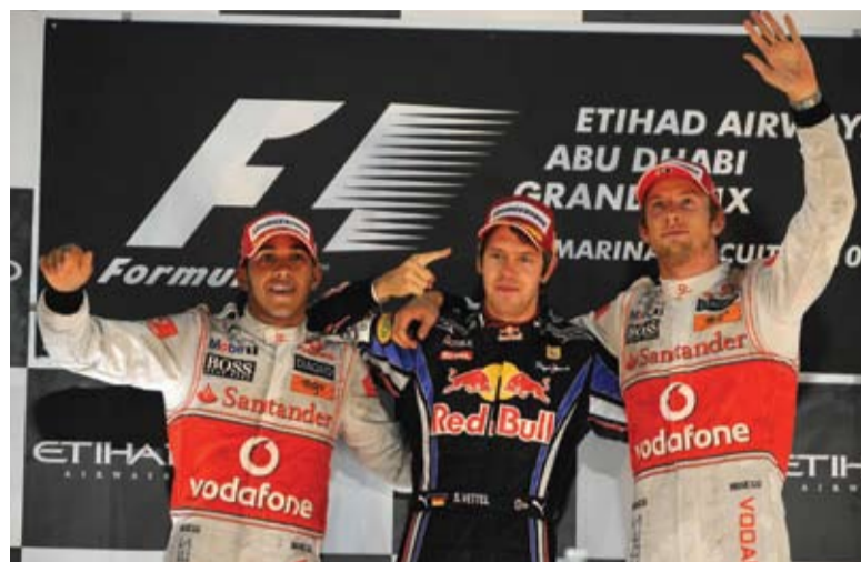
Muchos no contaban con que los Mercedes se podrían colar y subieron al podio.