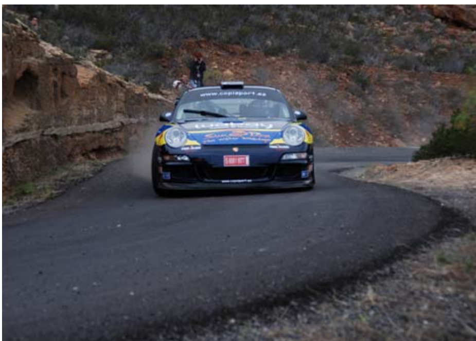
Ganadores Lorenzo/Gómez con una ventaja de 2 segundos y 60 décimas y un poco de suerte.