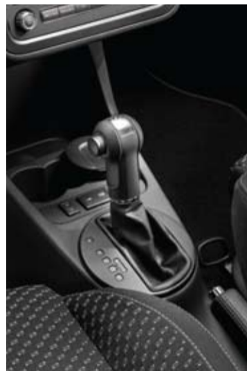
El cambio DSG es parte de la clave.