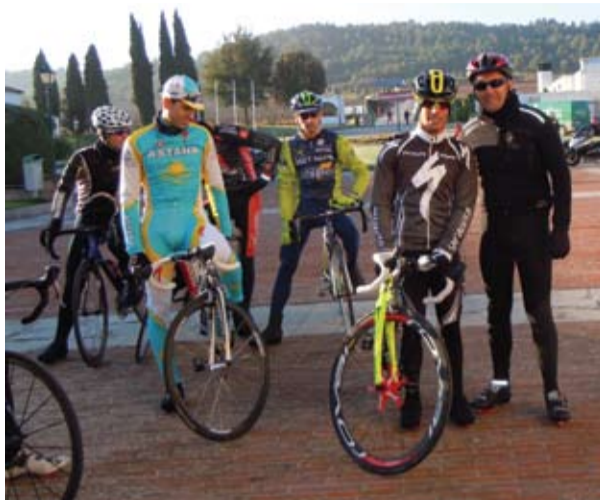
Yiyo junto al Campeón del Mundo de MOTO2.

Todos hemos tenido ilusiones y promesas. No son pocos los que vamos a Candelaria por uno u otro motivo. Y eso le pasó a Toni Elías, Campeón del Mundo 2010 de MOTO2. Cuando bajó de MotoGP a MOTO2, todo parecía un paso atrás y que su carrera fuera en decadencia, pero el bravo piloto manresano no se achicó y puso toda la carne en el asador. Se proclamó campeón del mundo con todo merecimiento. Y de ahí salió su promesa de subir a Montserrat en bici, un deporte que practica con asiduidad y muy bien. Tenía conocimiento de ello y sabía de los pormenores de la ruta pero nunca me pasó por la cabeza que fuera invitado a ir. En principio y por lo complicado del recorrido hablé con Javi del Amor para ir en moto y acompañar a los sufridores del ciclismo, pero un problema de logística de última hora me dieron como solución ir en bici. Y allí estaba, el día 25 de noviembre a los 8 de la mañana con “0” grados de temperatura y una bici prestada por Albert Rusines. La cava de Segura