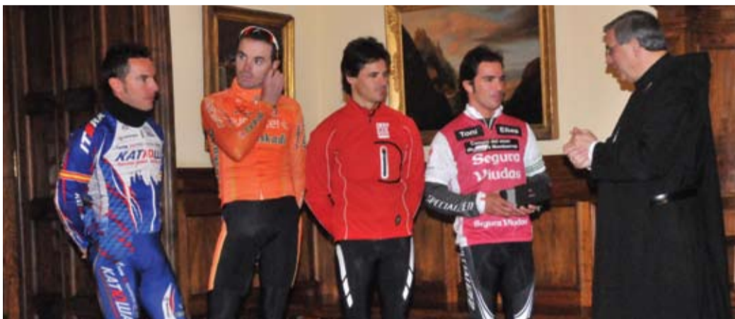
El abad de Montserrat entrega la medalla de la “Moreneta” a Toni Elías.