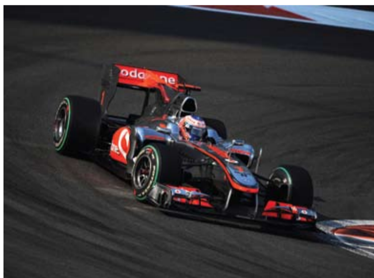
Mercedes y Renault fueron la ayuda que necesitaba Vettel para ser campeón.