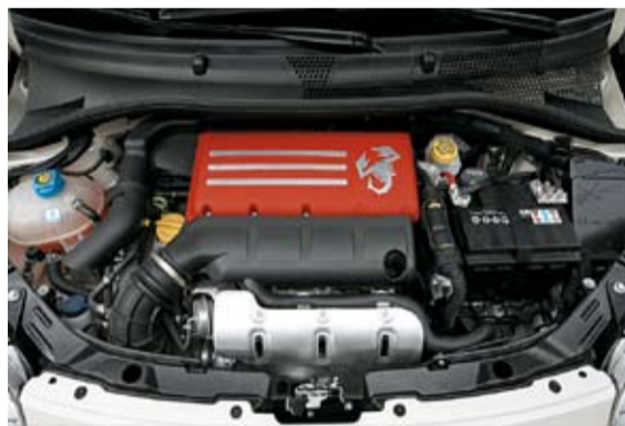
El escorpión es sinónimo de prestaciones y rendimiento.