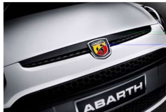
La marca está dispuesta para nuevos e interesantes retos.