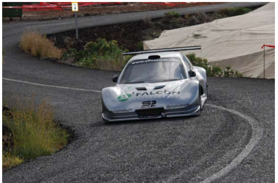
Pedro Roca, que se impuso en barquetas, dedicó su triunfo a Pantxo Egozkue que anunció su retirada del automovilismo.