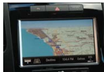
Intuitivo y eficiente, el GPS.