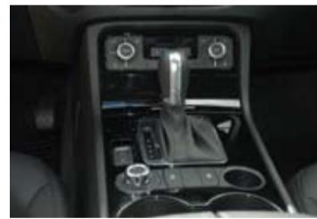
Nuevo cambio automático de 8 vel.