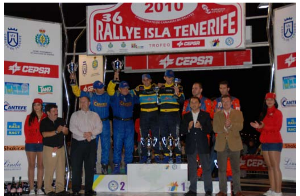
Un rally donde la clave estuvo seguramente en la resolución con éxito de muchos problemas previos.