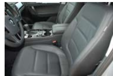
Interior elegante y bien acabado.