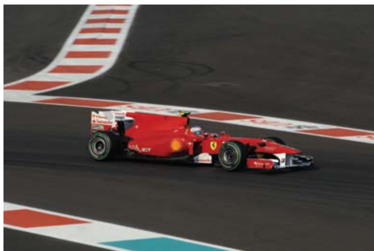
Alonso sufrió con un coche sin posibilidades y por una estrategia equivocada.

Texto: José de la Riva