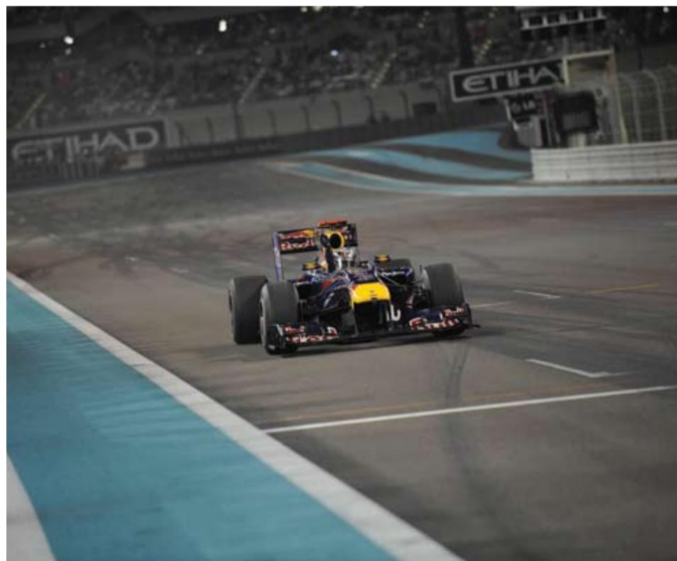
Vettel arrebató a Hamilton el honor de ser el piloto más joven en conseguir un campeonato de F1.