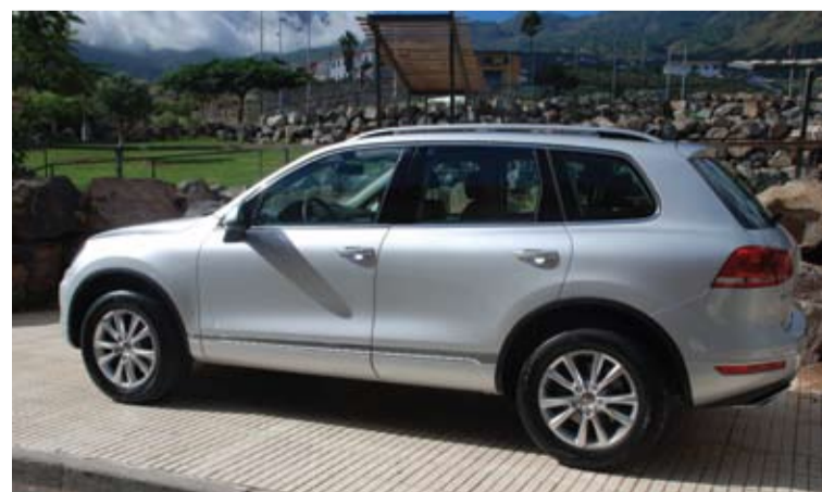
El nuevo diseño ha mejorado notablemente la imagen y la aerodinámica.