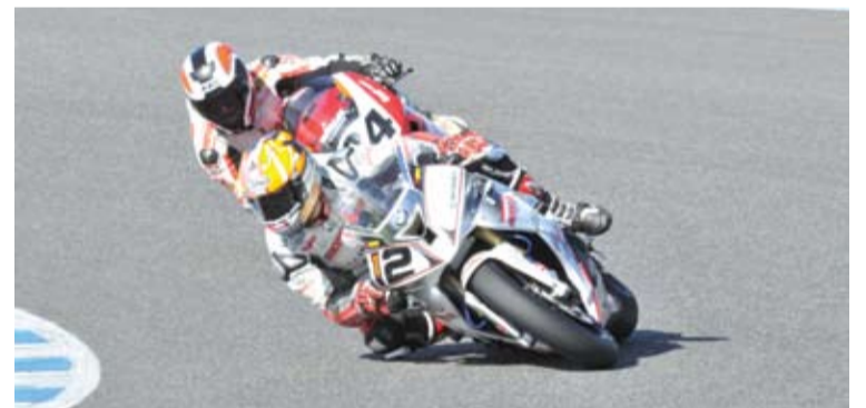
Forés y Del Amor lucharon codo a codo toda la temporada.