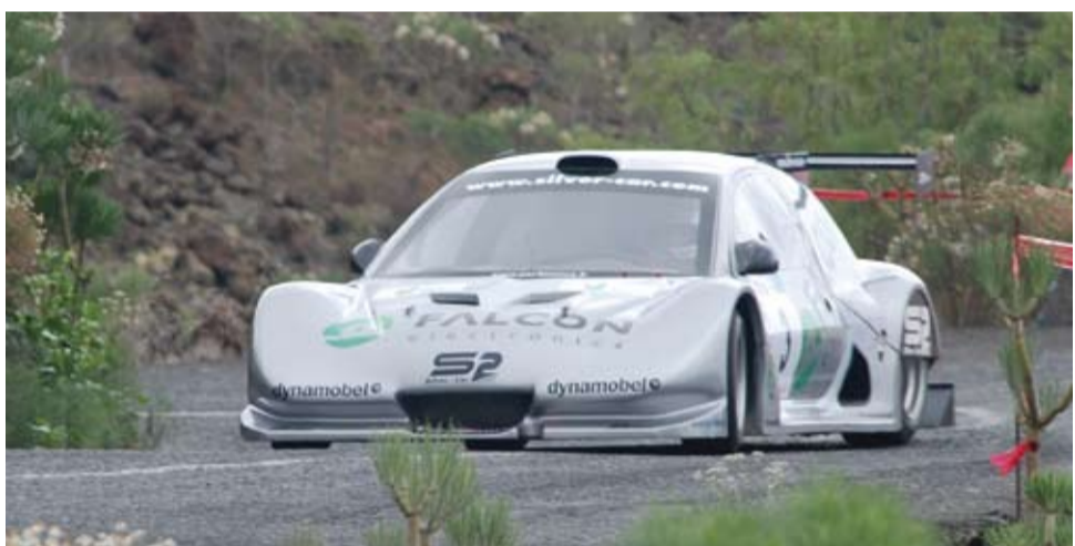
El peninsular Pedro Roca vencedor en Guía de Isora. Pág. 14