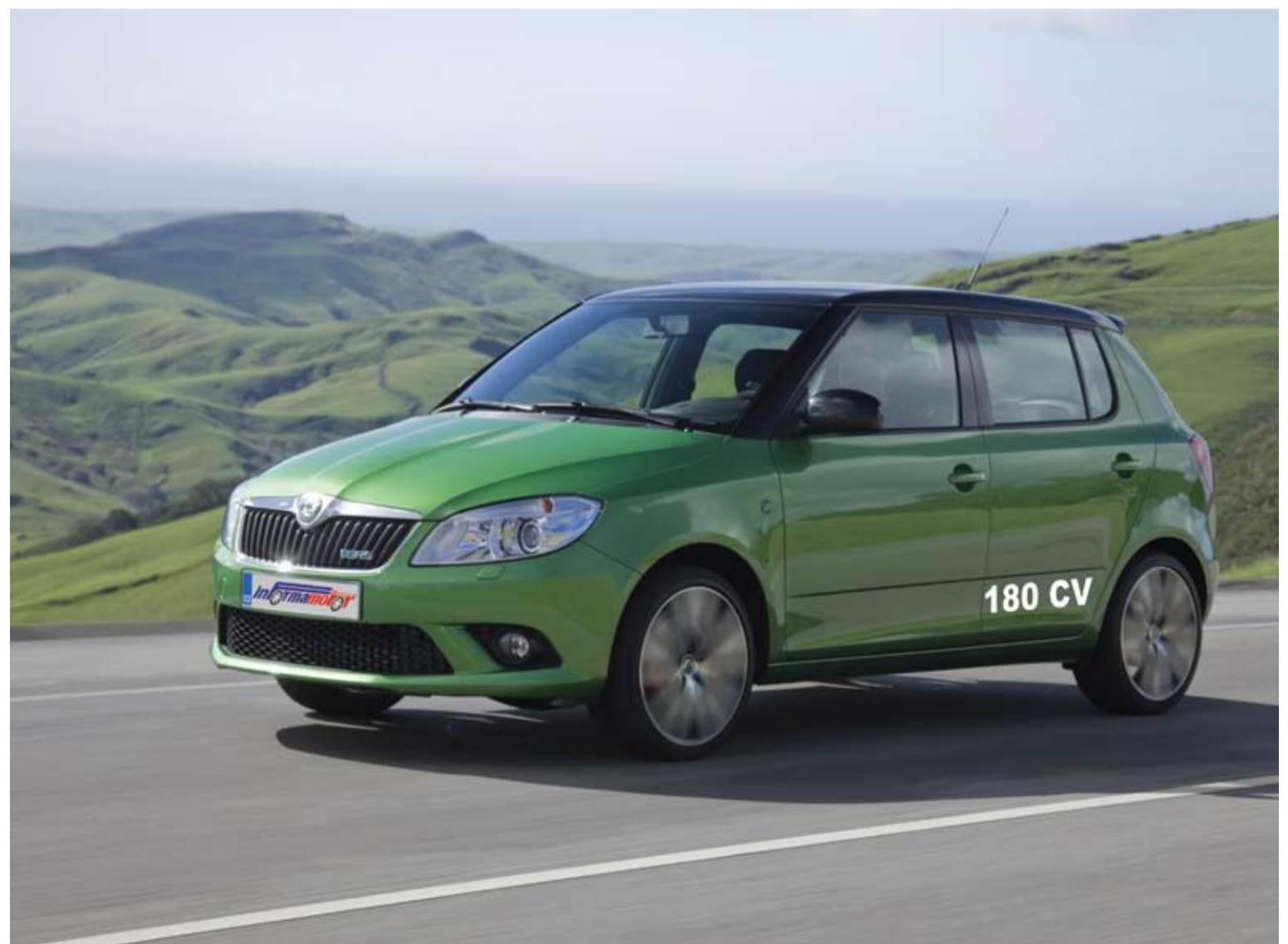
El Skoda Fabia RS sorprende y es capaz de satisfacer a los usuarios que buscan un coche con prestaciones sin perder de vista la versatilidad y un precio razonable.