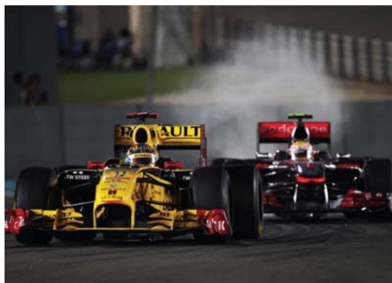
Tanto Kubica como Petrov hicieron de tapón y no cedieron ante los Ferrari.