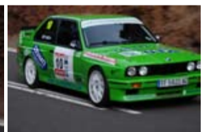
C. Padilla 1º grupo TA.