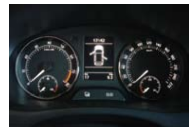
Completo ordenador de a bordo