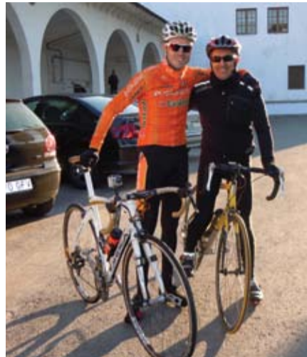
Samuel Sánchez, campeón olímpico en Pekín.