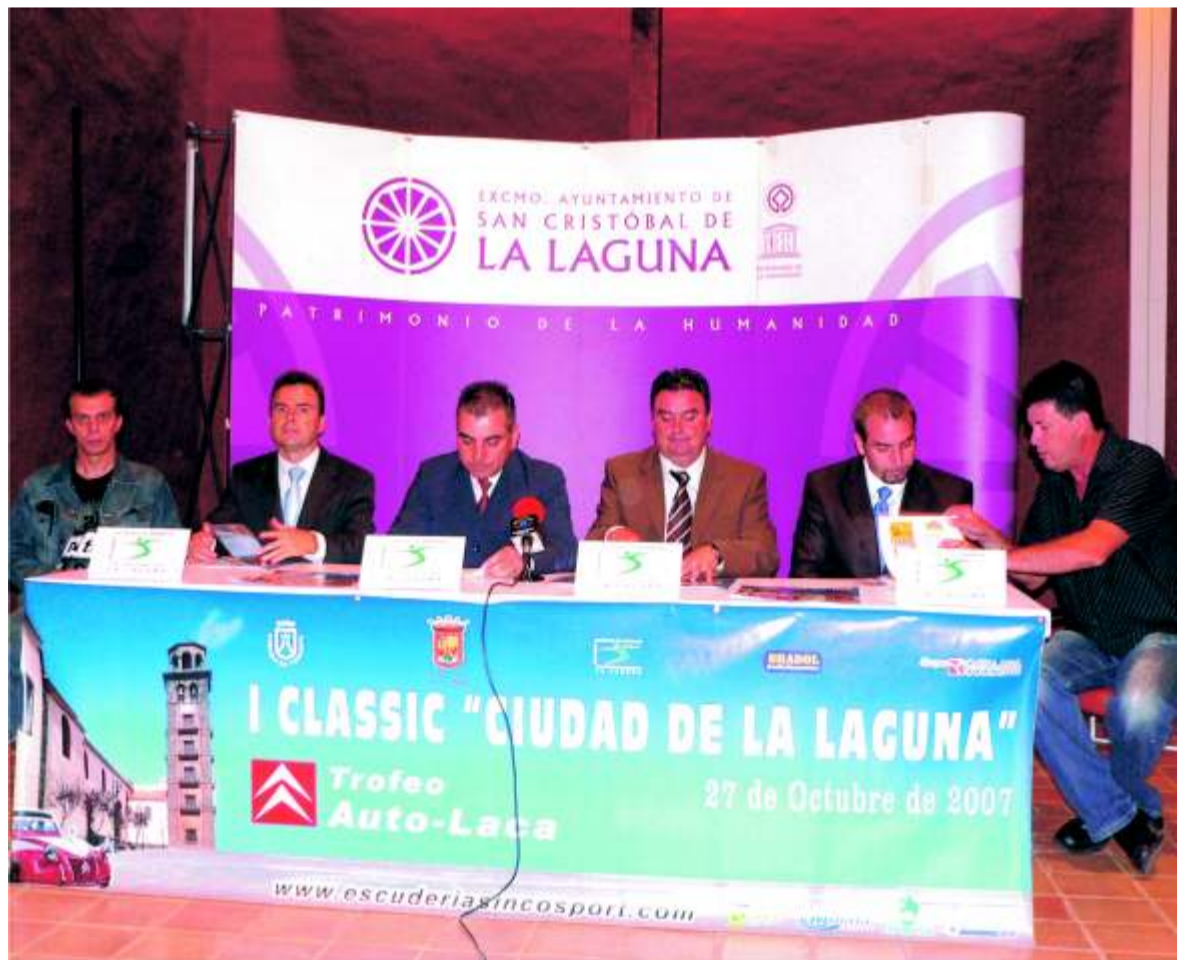
Arriba: Momento de la presentación en el Ayuntamiento de La Laguna Izquierda: Programa horario