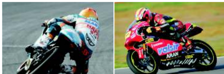
Hector Faubel todavía tiene opciones