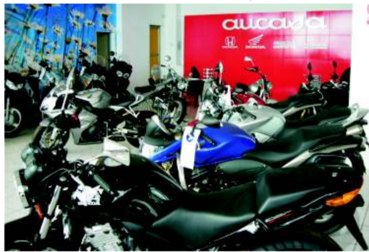
Una completa exposición, en Gral Mola 37, facilita la elección del cliente.