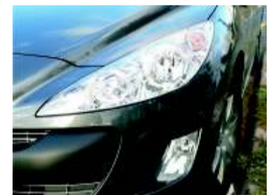
Completo grupo óptico