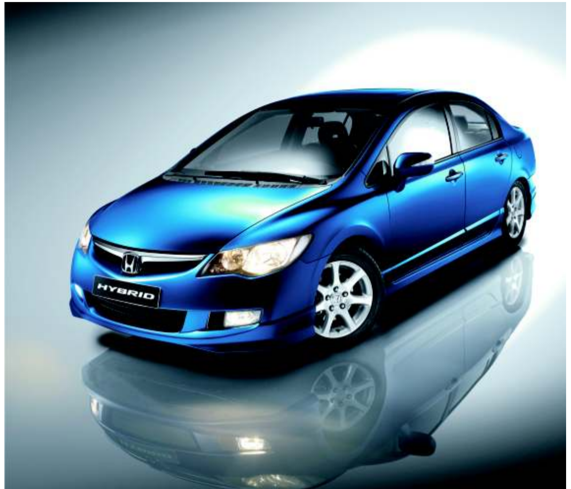
La única diferencia con un vehículo convencional es que tendrá que pasar menos veces por la gasolinera.