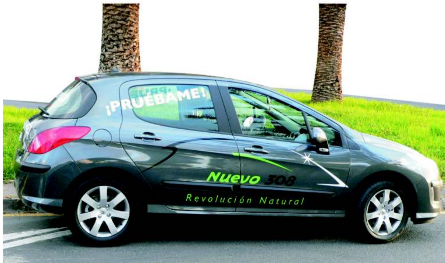
El 308 con la decoración para pruebas de Automotor