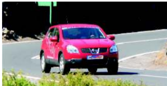
Un vehículo ya integrado en la geografía canaria