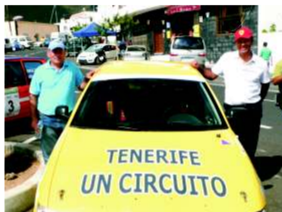
Presidente de la Federación y consejero (¿Reivindicación?)