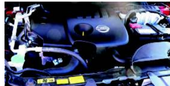
Disponible con una interesante gama de motores