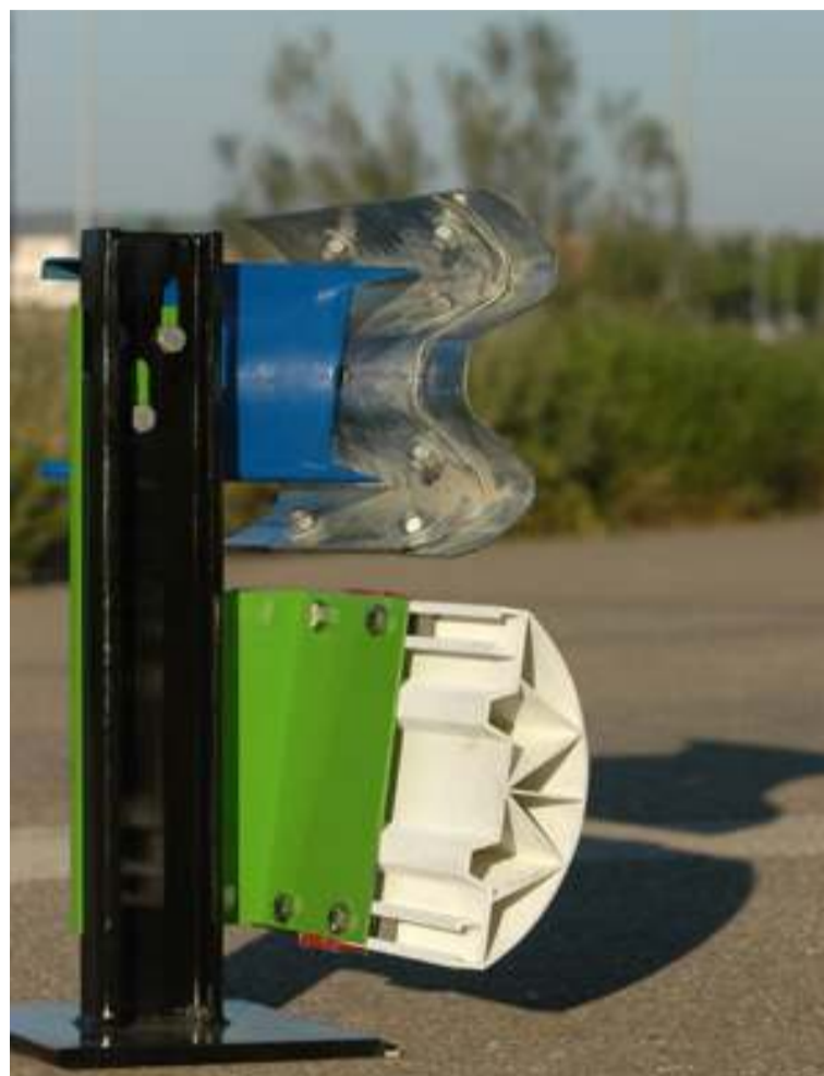
Son muchas las alternativas pero pocas las llevadas a la práctica YA