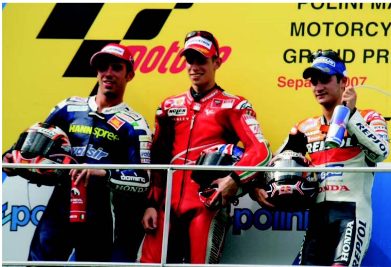
En Sepang el binomio Stoner/Ducati volvió a demostrar todo su poderío.