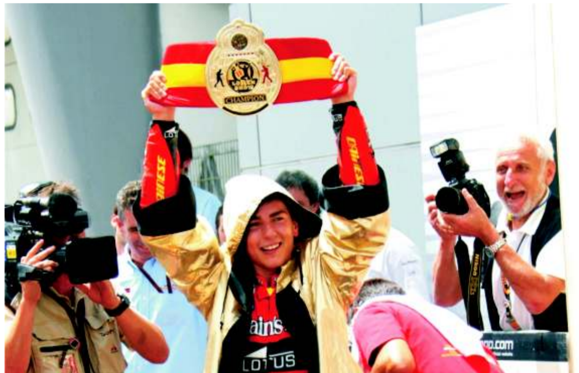
Sus celebraciones podrán gustar o no. Pero Lorenzo es un gran campeón