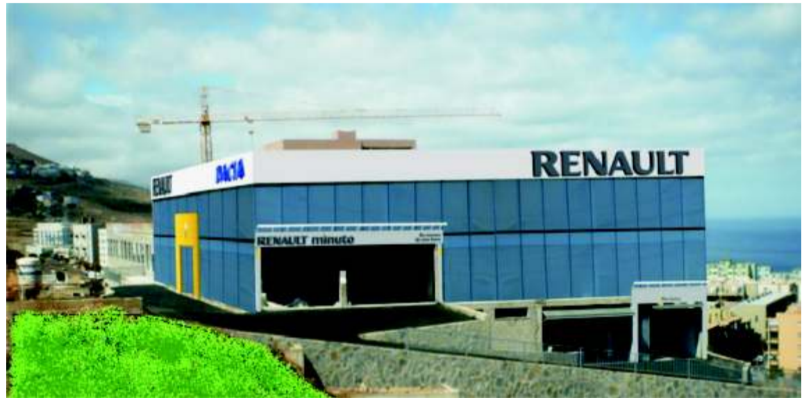
La foto es un montaje de cómo veremos las nuevas instalaciones, desde la autopista del sur, hacia Santa Cruz.