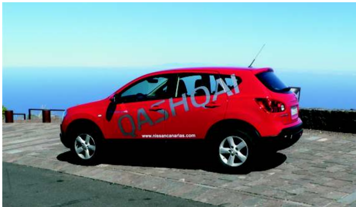
Un completo equipamiento, unido a una línea muy acertada, han contribuido al éxito de ventas del Nissan Quashqai