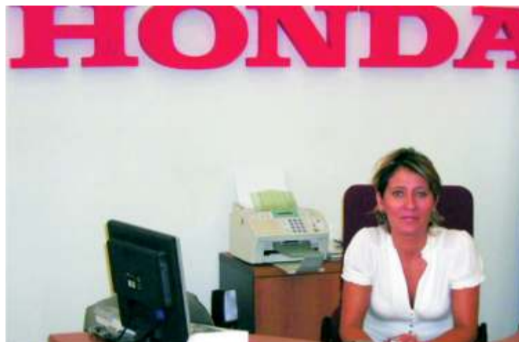
Candelaria contestó amablemente a todas nuestras preguntas