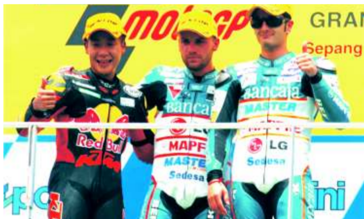
El podio de 125 en sepang. Los chicos de Aspar siguen "haciendo publicidad"