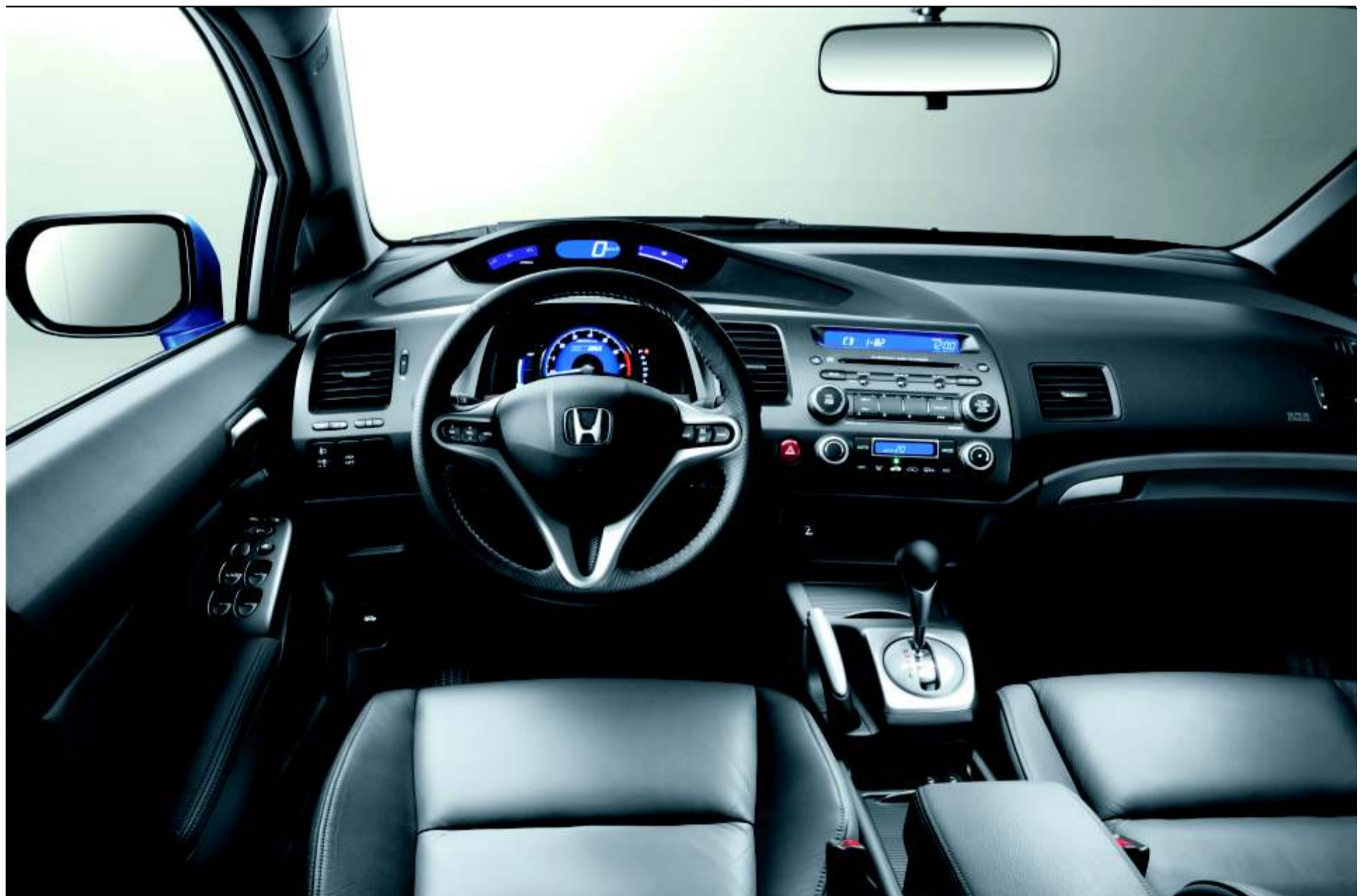
Una imagen que demuestra que las nuevas tecnologías no están reñidas con el diseño, la comodidad y los buenos acabados