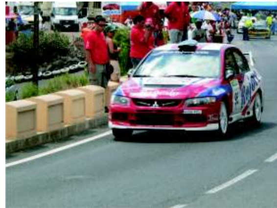
Víctor Fariña fue primero en GrN y batió el record