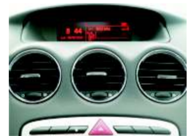
Aireación y display multifunción