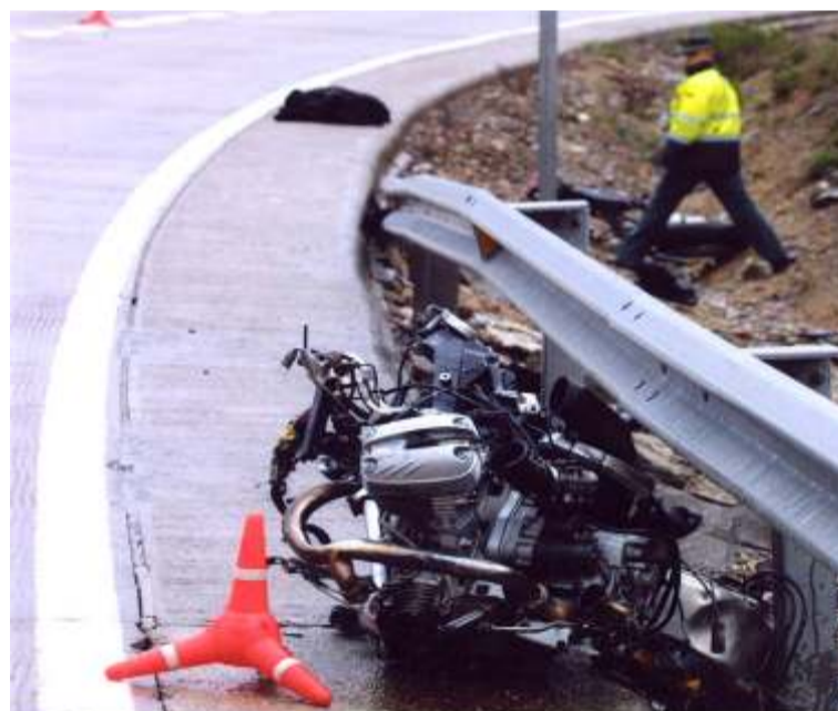
Es desagradable ver cómo las vallas se comportan como auténticas guillotinas