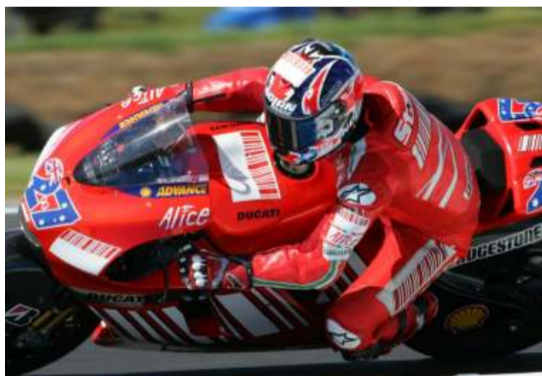
Stoner no dió opción a sus rivales