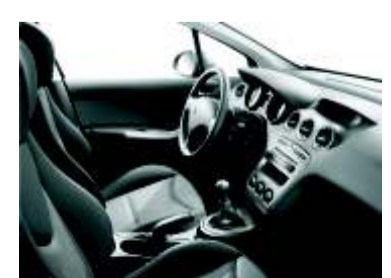
Un interior agradable y bien acabado