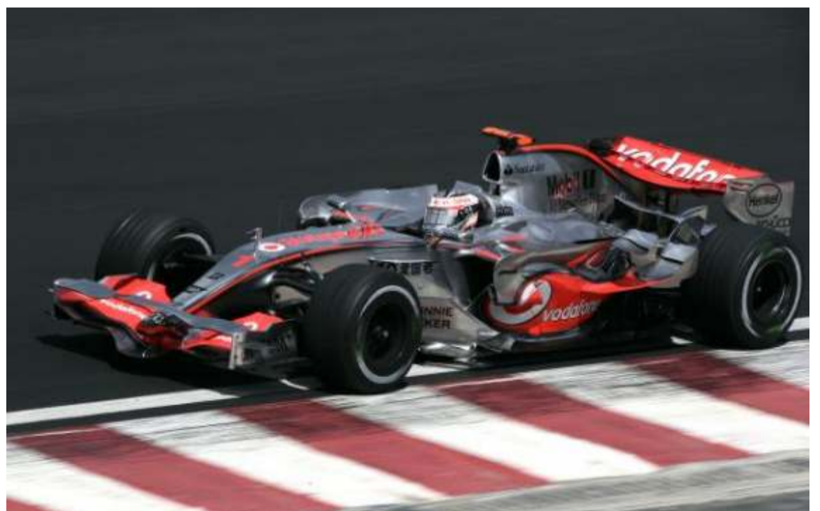
Fernando ha conducido compitiendo ¡contra su propio equipo!. Es el colmo de la competición...