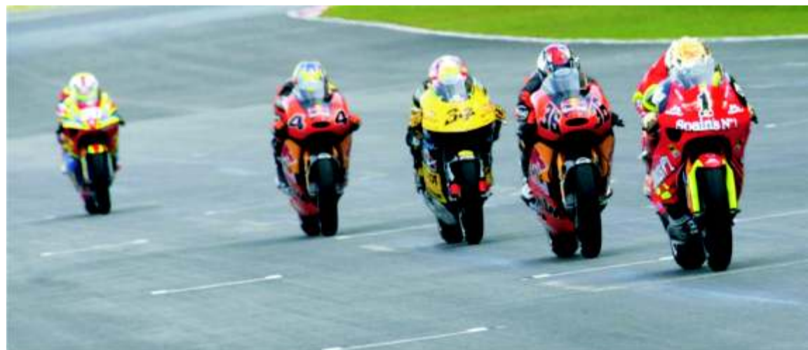
Lorenzo, que acabó tercero, se proclamó Campeón del Mundo 2007 de 250