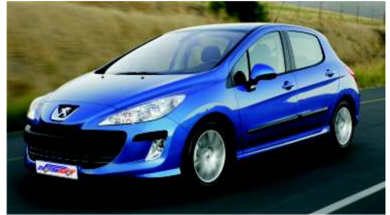
Una línea muy moderna y personal

Un comportamiento en carretera ejemplar constituye la base de la seguridad primaria. Está completada por una dotación de equipos tales como el sistema de Alerta de Cambio Involuntario de Carril (AFIL) y los faros bi-xenón direccionales.