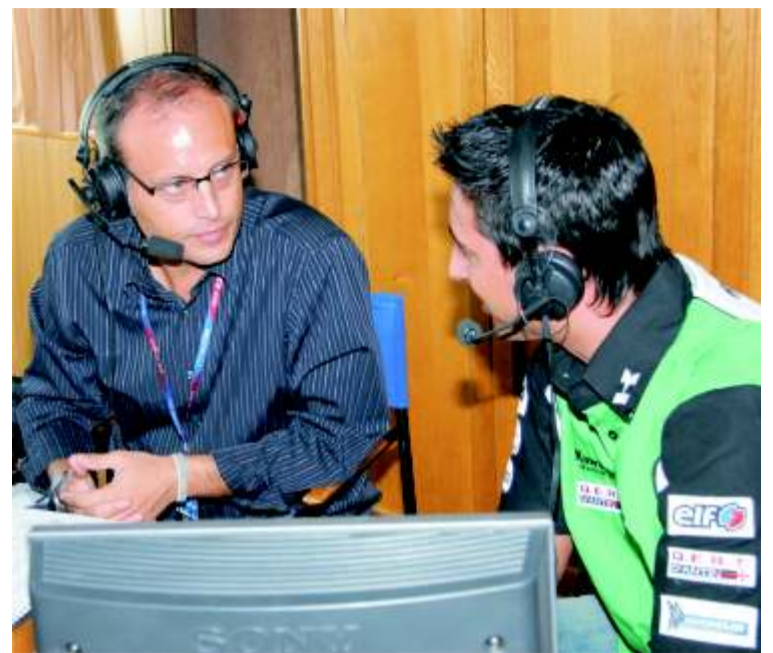
El periodista, curtido en mil batallas, es un gran comunicador