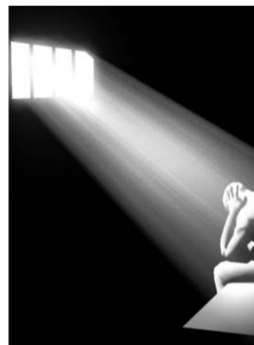
A la cárcel tendrían que ir muchos antes que los que se pasan de velocidad...

Todo esto viene a cuento por las movidas del último iluminado de la DGT haciendo aprobar una ley mediante la cual, los que vayan un poco más rápido de lo que a ellos, sin criterio ninguno (según vienen demostrando), se les ocurra pueden ir a parar a la cárcel.