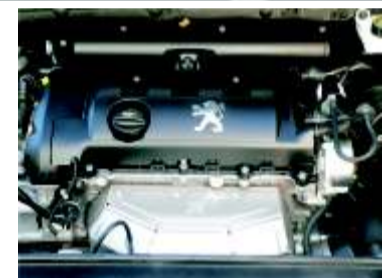
Una amplia oferta de motorizaciones