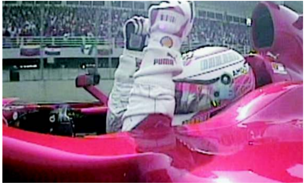
Kimi levanta los brazos. La segunda opción, en cuanto a preferencias de los aficionados españoles, se ha materializado.