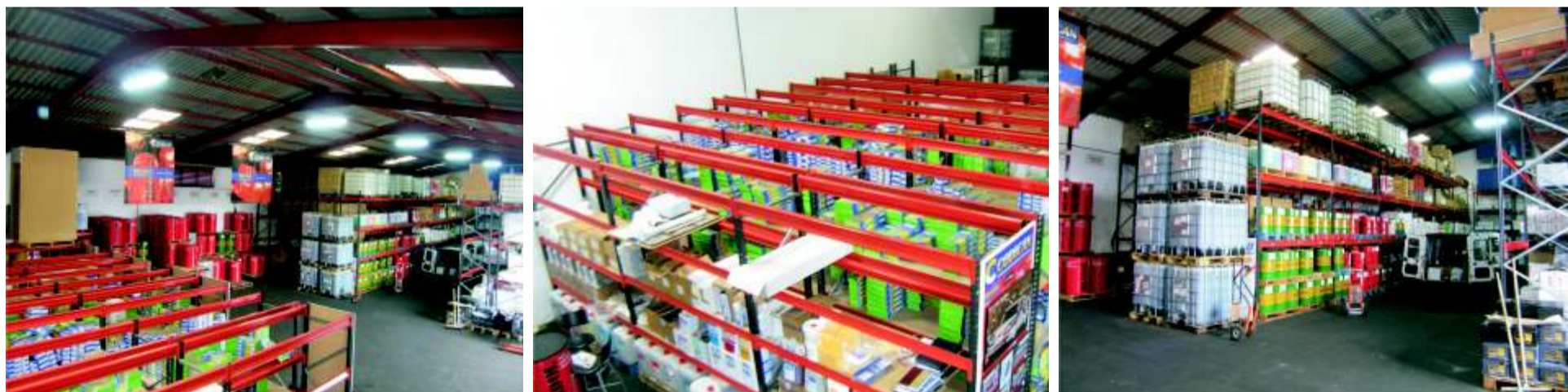
Unas amplias instalaciones con la organización adecuada permiten a Codican satisfacer todas las necesidades del mercado canario en el sector