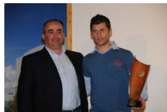
Fiesta de la moto Entrega de Trofeos