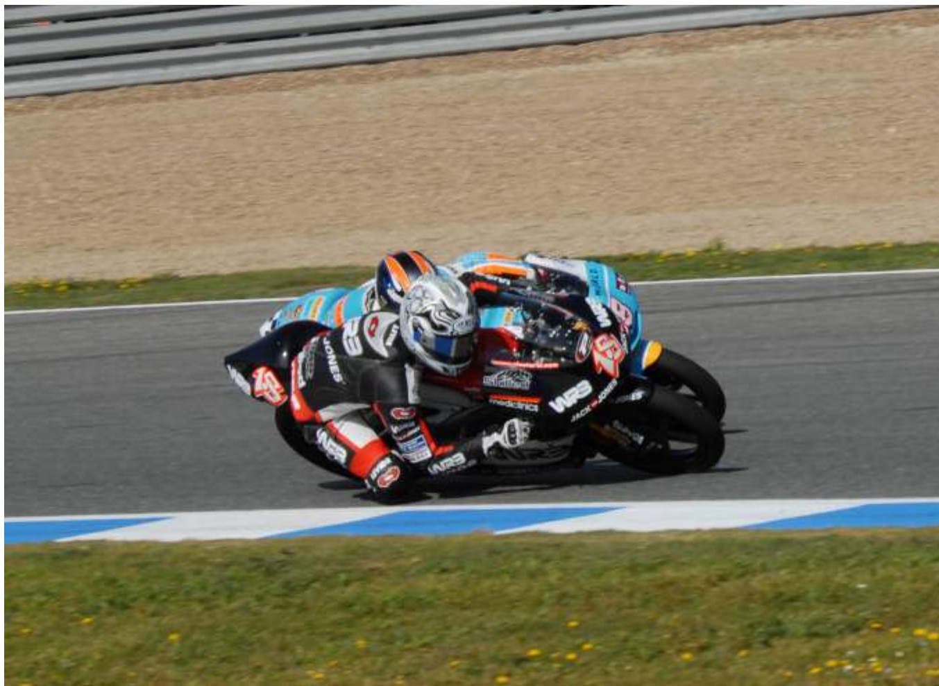
Nico Terol luchó con Bradley Smith para conseguir su primer podio en el mundial de 125 cc