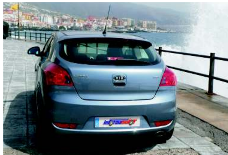
La parte trasera