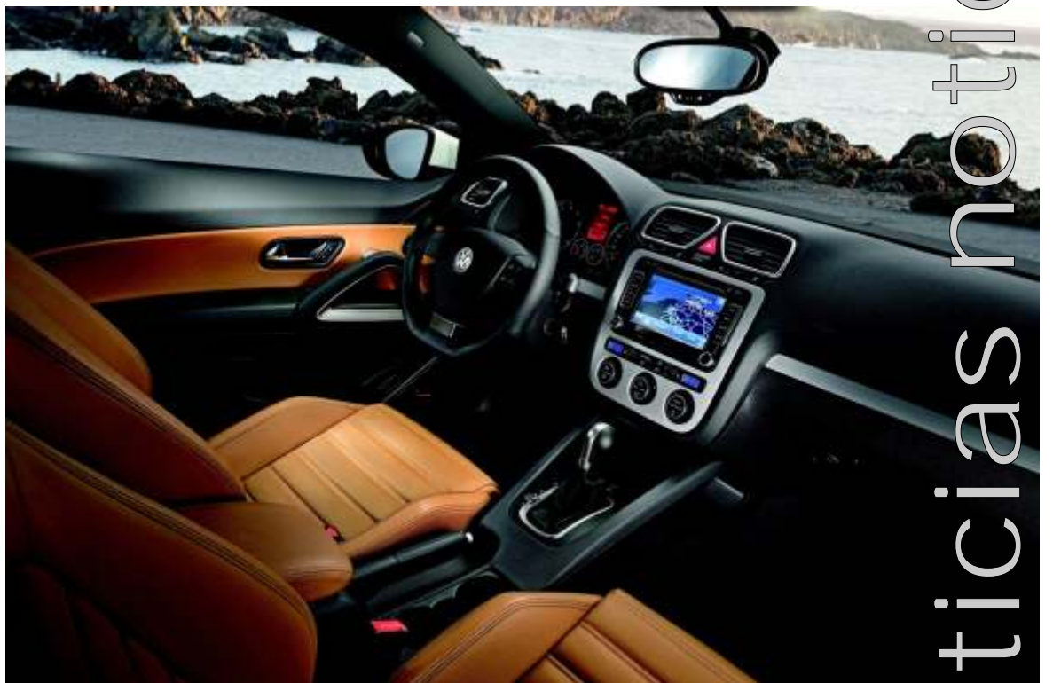
A falta de verlo en directo tenemos las fotos en las que el coche "promete"