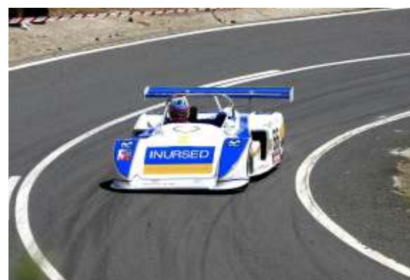
X Subida a Los Loros Lamberti y Averó