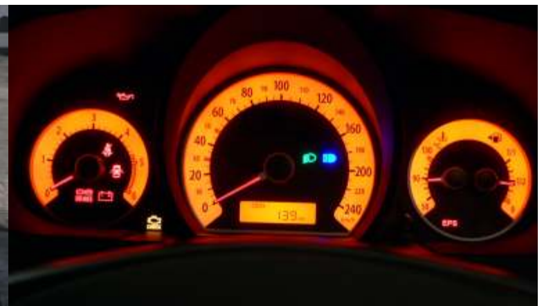
Cuadro de instrumentos de fácil lectura