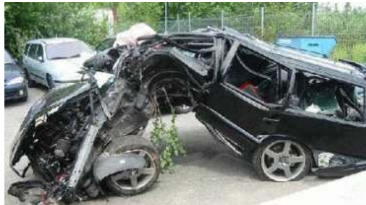
La simple imagen del estado en el que quedan los coches es para pensar

No se enseña a conducir a los novatos. Salen a la carretera, a practicar tras haber demostrado que saben aparcar, y el tráfico no está para bromas ni inventos.