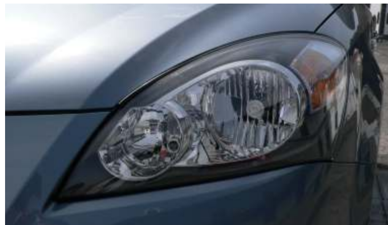
Detalle del grupo óptico delantero