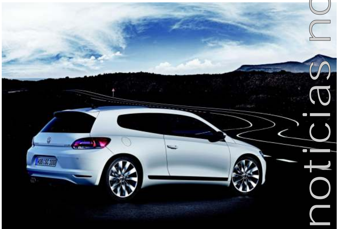
Un coche con argumentos para soñar