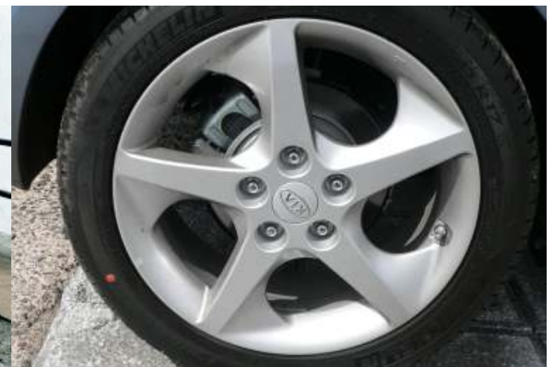
Las llantas de aleación con neumáticos de 17"