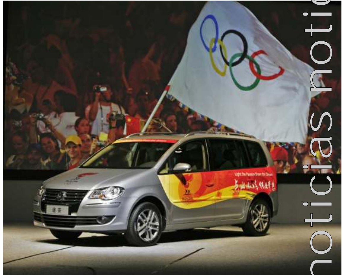
El patrocinio de los Juegos Olímpicos chinos representa un esfuerzo importante con una repercusión mundial incalculable.

varios años con el fútbol, el pádel, el voleibol, el windsurf y el surf, entre otros.