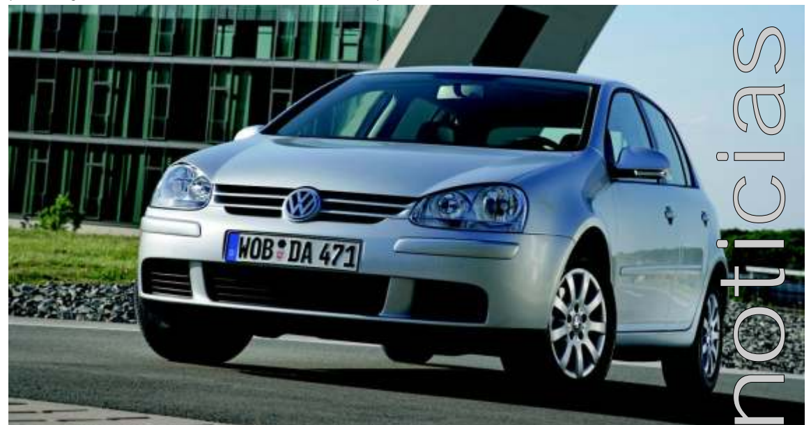
BlueMotion: Polo, Golf, Golf Plus, Golf Variant, Jetta, Passat, Passat Variant y el estudio Caddy BlueMotion

Volkswagen no sólo está a la vanguardia en las cifras de consumos y emisiones, sino también en el desarrollo de las técnicas más innovadoras para el cuidado del medio ambiente en los procesos de producción y reciclaje de los vehículos.