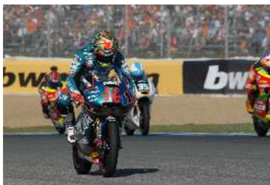
Talmacsi en el momento de romper su moto