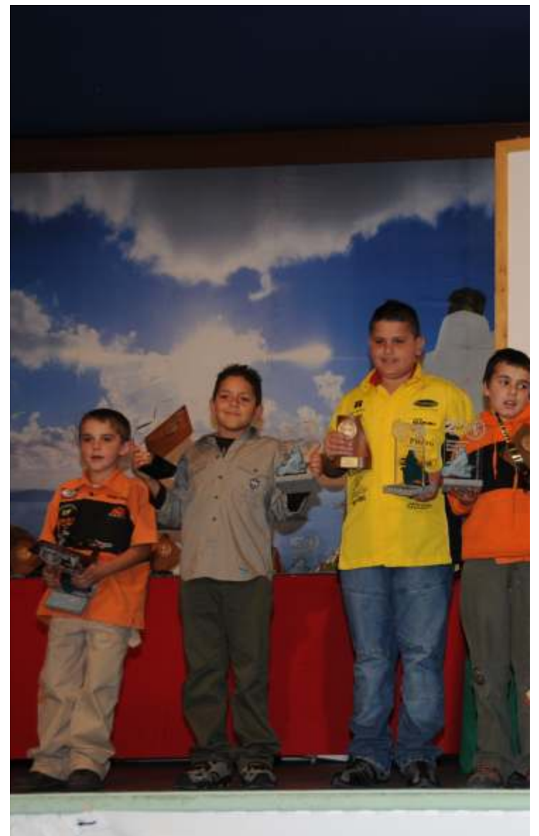
Los pequeños pilotos de motocross recibieron la ovación de la noche.

Para la Federación Interinsular tinerfeña el acto ponía también punto y final a una de las mayores apuestas de Ventura Darias y es que la Copa de Pit Bikes, creada