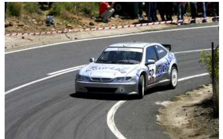
Ricardo Avero, con algunos problemas en su montura, vencedor indiscutible