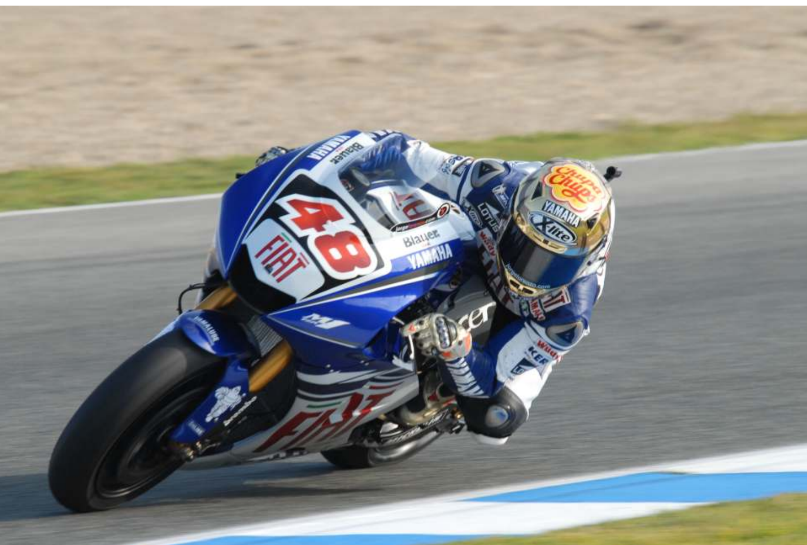
Jorge Lorenzo batió el record del circuito en cuatro ocasiones durante los entrenamientos