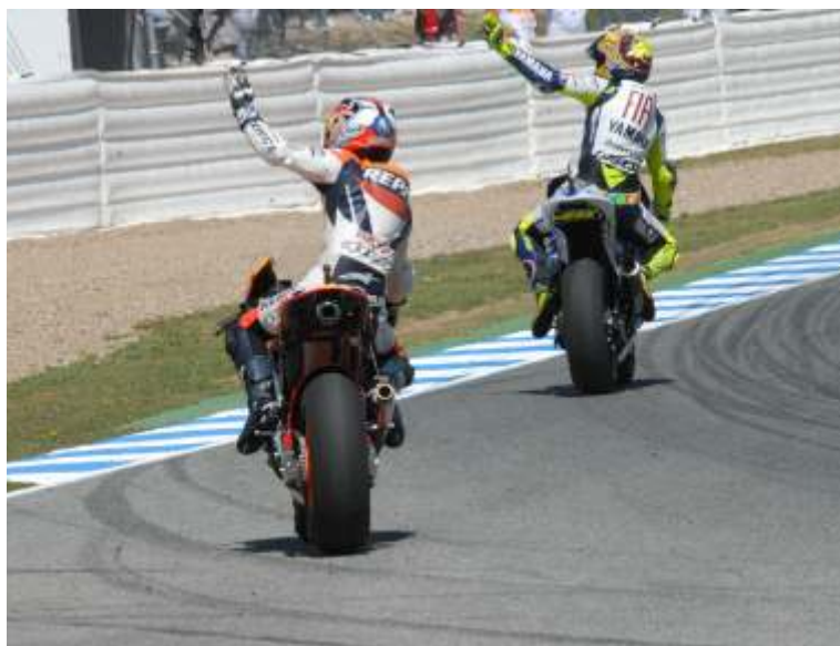
Todos los pilotos se rindieron ante la mejor afición, también Rossi y Pedrosa