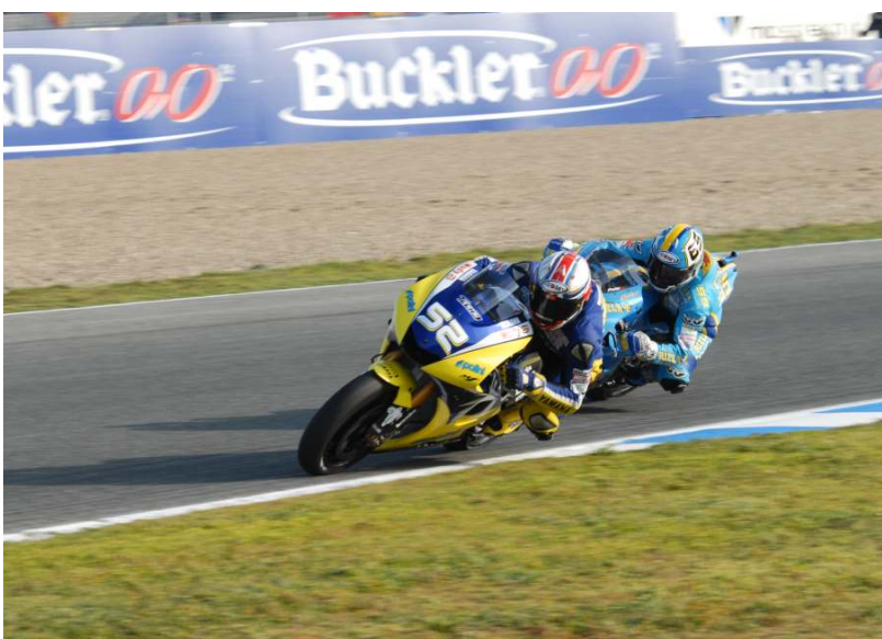
El campeón del mundo de SBK, James Toseland se peleó durante la carrera con Capirossi