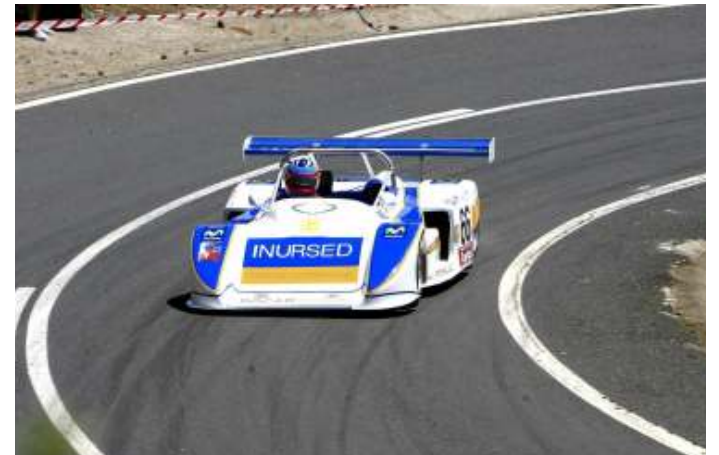
Carlos A. Lamberti puso a trabajar la caballería de su barqueta para ganar