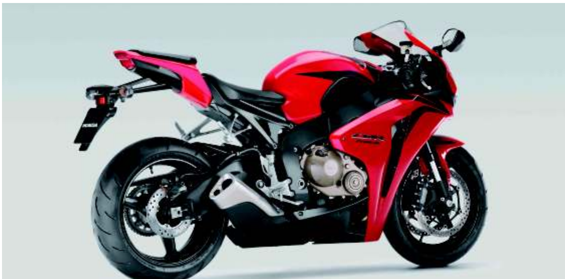
Un diseño agresivo que no pasará desapercibido a los ojos de los aficionados a las motos con estilo