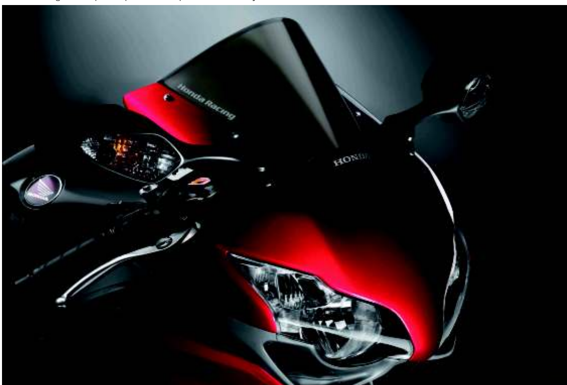
Detalles de los retrovisores con intermitentes integrados y los faros delanteros