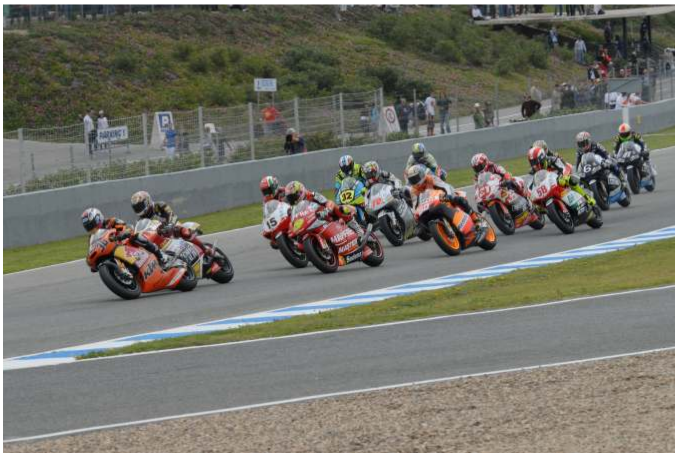
Kallio fue el primero en mandar y finalmente se hizo con la victoria en 250cc