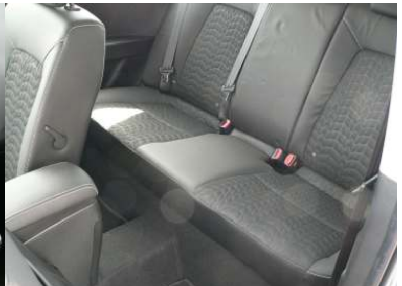
El espacio en las plazas traseras es amplio y con buen acceso