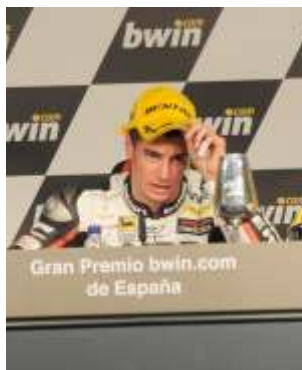
Corsi: 2ª victoria en el Mundial