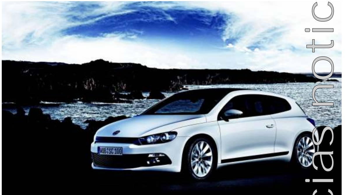
No se parece en nada al anterior Scirocco pero es, igualmente, un coche muy actual basado en la deportividad