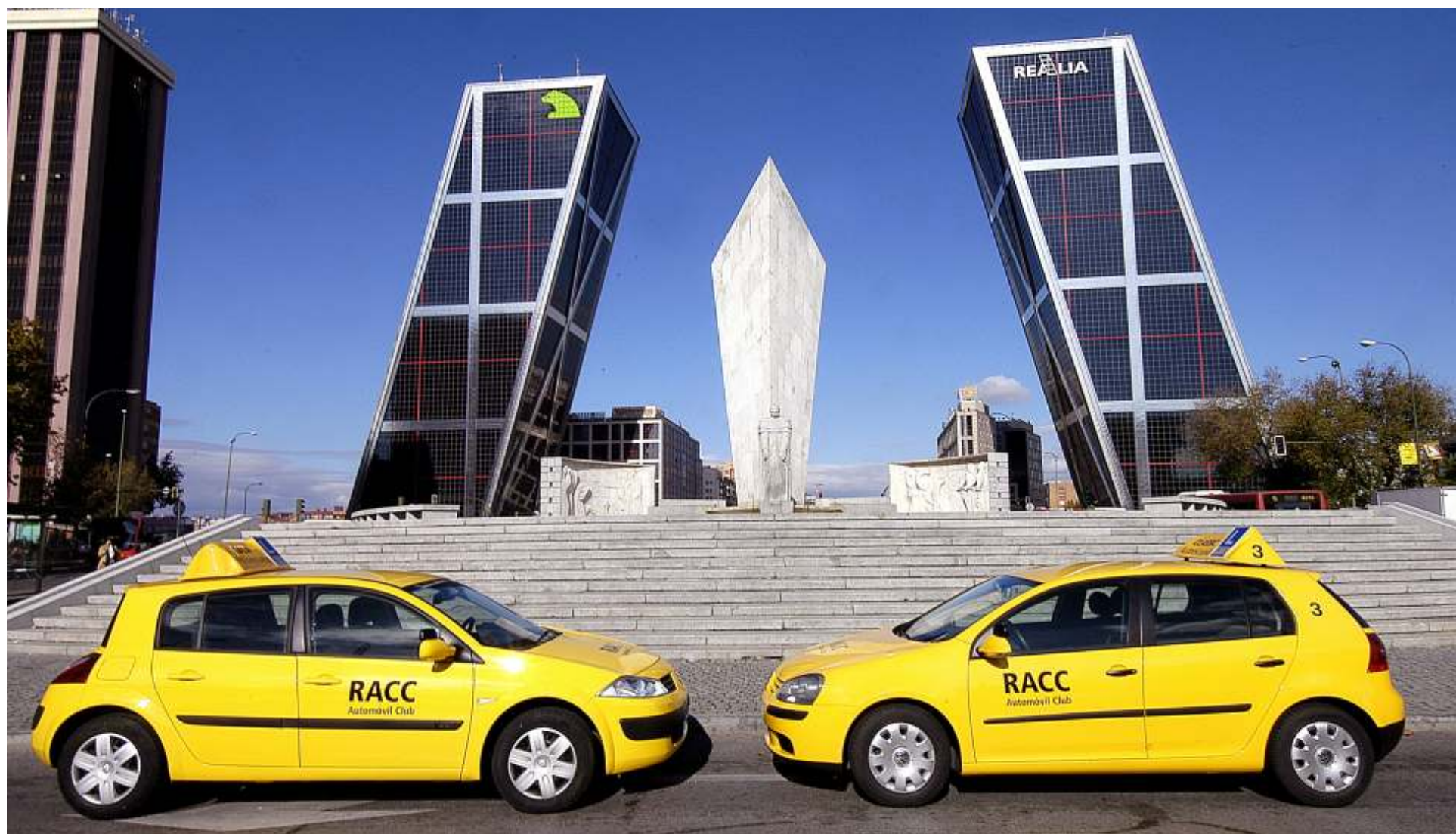
El RACC se adhiere al programa del Ministerio del Interior