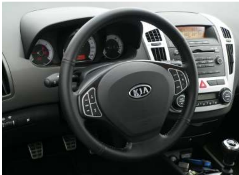
El puesto de conducción es, desde el punto de vista ergonómico, perfecto