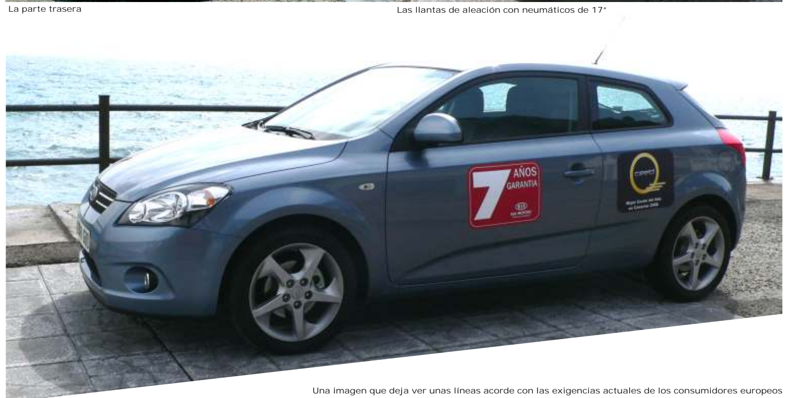
Una imagen que deja ver unas líneas acorde con las exigencias actuales de los consumidores europeos