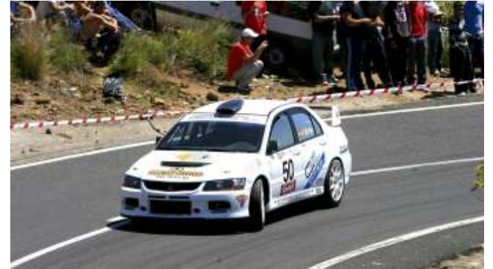
Félix Brito, con su Mitsubishi EVO IX, 2º de A2 y 7º de la general de carrozados