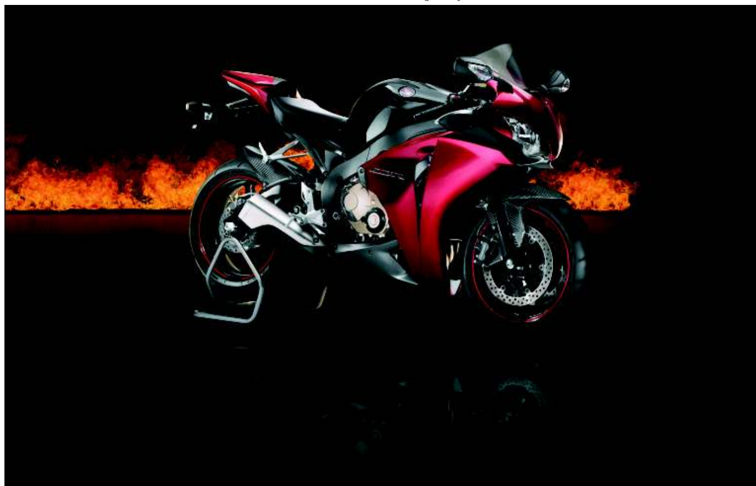
Espectacular imagen de la nueva HONDA CBR1000RR